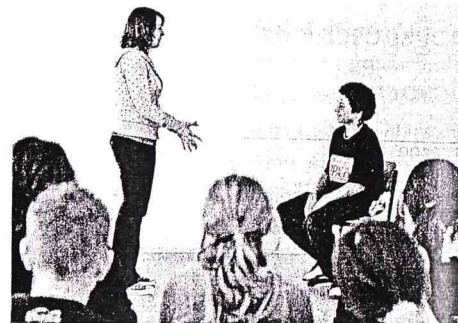
Bewerbungstraining 9. Klasse - TPZ Hildesheim

Juliane Steinmann: Wir bieten unter anderem eine Fortbildung zum Thema "Sprachförderung mit Theater" an, Theaterspielen in der Grundschule I und II, wir haben eine Lehrertheatergruppe, Fortbildungsmodule "Improvisationstheater" oder "Märchen und Erzählen". Ab 2009 werden wir Fortbildungsmodule im Darstellenden Spiel anbieten.