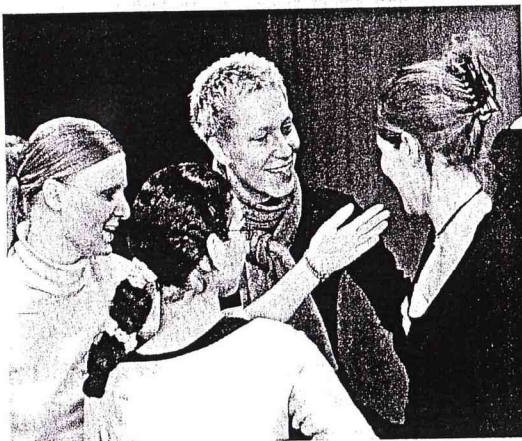
Workshop zu "Top Dogs" von Urs Widmer - Stadttheater Hildesheim

Die meisten sind AbsolventInnen des Studiengangs "Kulturwissenschaften und Ästhetische Praxis" an der Universität Hildesheim. Über die Jahre wuchs ein lebendiges Netzwerk von Fachleuten zusammen, die sich monatlich zum Austausch treffen, gegenseitig hospitieren, Aufträge weiterreichen und die Theaterpädagogik in Hildesheim durch ihre persönlichen Fähigkeiten und Kenntnisse innovativ bereichern.