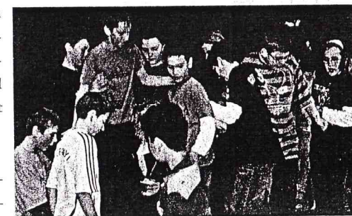
Teamtraining: Die Reise mit dem Schrumpfbus - TPZ Hildesheim

Das TPZ Hildesheim finanziert sich bisher fast vollständig aus Teilnehmerbeiträgen, hat aber auch mit der Einwerbung anderer Gelder begonnen - zum Beispiel für die Weiterführung des BVJ-Projekts - Theater mit Schüler/innen im Berufsvorbereitungsjahr - , das vor 2 Jahren erstmals durch "Räuber" medienwirksame Aufmerksamkeit bekam. Die Bürgerstiftung Hildesheim bezahlt die Grundmiete für ein Jahr, die Volksbank hat Sponsoring für Büroausstattung und Werbemittel angekündigt und bereits einen Drucker für uns gekauft. Zudem bietet das TPZ Patenschaften für einzelnen Theaterprojekte an, die durch den Paten in einer von ihm gewünschten Höhe unterstützt wird.