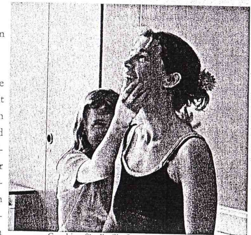
Coaching für die Chefin - TPZ Hildesheim

Wir sind offen für neue Projekte und Anfragen. Gerne versuchen wir uns an neuen Methoden, neuen Kombinationen von Beteiligten und Kunstformen oder an neuen Zeitstrukturen. Kein Workshop gleicht dem anderen. Ein anderer Punkt ist unsere Netzwerkarbeit. Wir veranstalten monatliche Austauschtreffen unserer freien MitarbeiterInnen im Theater zum gegenseitigen theoretischen wie praktischen Austausch und gegenseitige Hospitationen. Davon profitieren letztlich alle Mitwirkenden, da man so immer wieder neue Inhalte und Formen, neuen Input für die eigene Arbeit bekommt. Wir sind zudem am Integrationsprozess der Stadt beteiligt, der sich beispielsweise über eine AG Kunst & Kultur oder der AG Elementarerziehung ausdrückt. Wir sind Mitglied der "IQ-Interessengemeinschaft Kultur", wo alle Kulturschaffenden Hildesheim zusammen kommen, um die Netzwerke auszubauen und gemeinsame Projekte zu entwickeln.